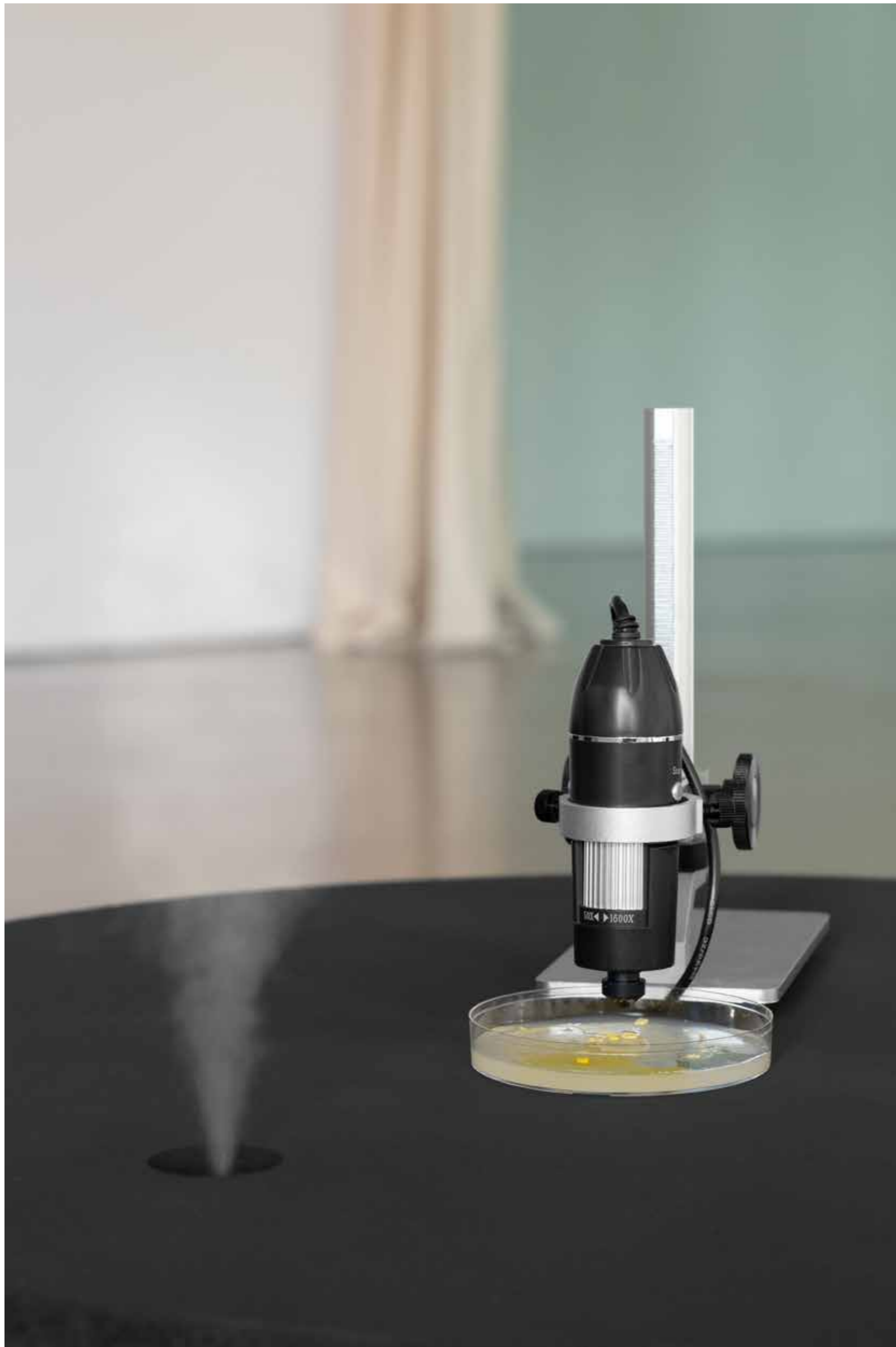
Slime Mould Vibrations , 2023 Slime Mould Herta, Digitalmikroskop, Körperschallwandler, Podeste, thermochrome Farbe / Slime Mould Herta, digital microscope, structure-borne sound transducer, pedestals, thermochromic paint Maße variabel / Dimensions variable