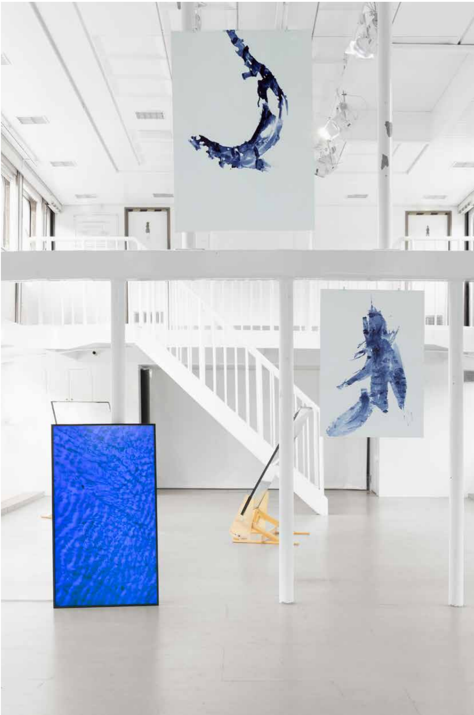
no t nkontra na frontera , 2023 Wasser, Licht, Papier, Tusche, Glas, Video / Water, light, paper, ink, glass, video Maße variabel / Dimensions variable

Dieses Poster erscheint anlässlich von Happy Hours. Meisterschüler*innen der HKK Bremen 2023 | This poster is released on occasion of Happy Hours. Master's students of HKK Bremen 2023 GAK Gesellschaft für Aktuelle Kunst mit / with Weserburg Museum für moderne Kunst & MS Dauerwelle 15.07.–27.08.2023